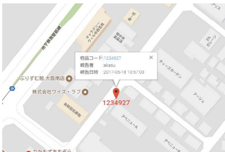
< 屋外マップでの位置表示例 >